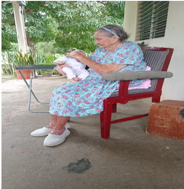
La reina de El Carate y su muñeca