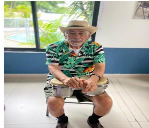
“La música es mi vida”