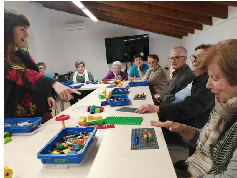
Talleres de reminiscencia con Legos