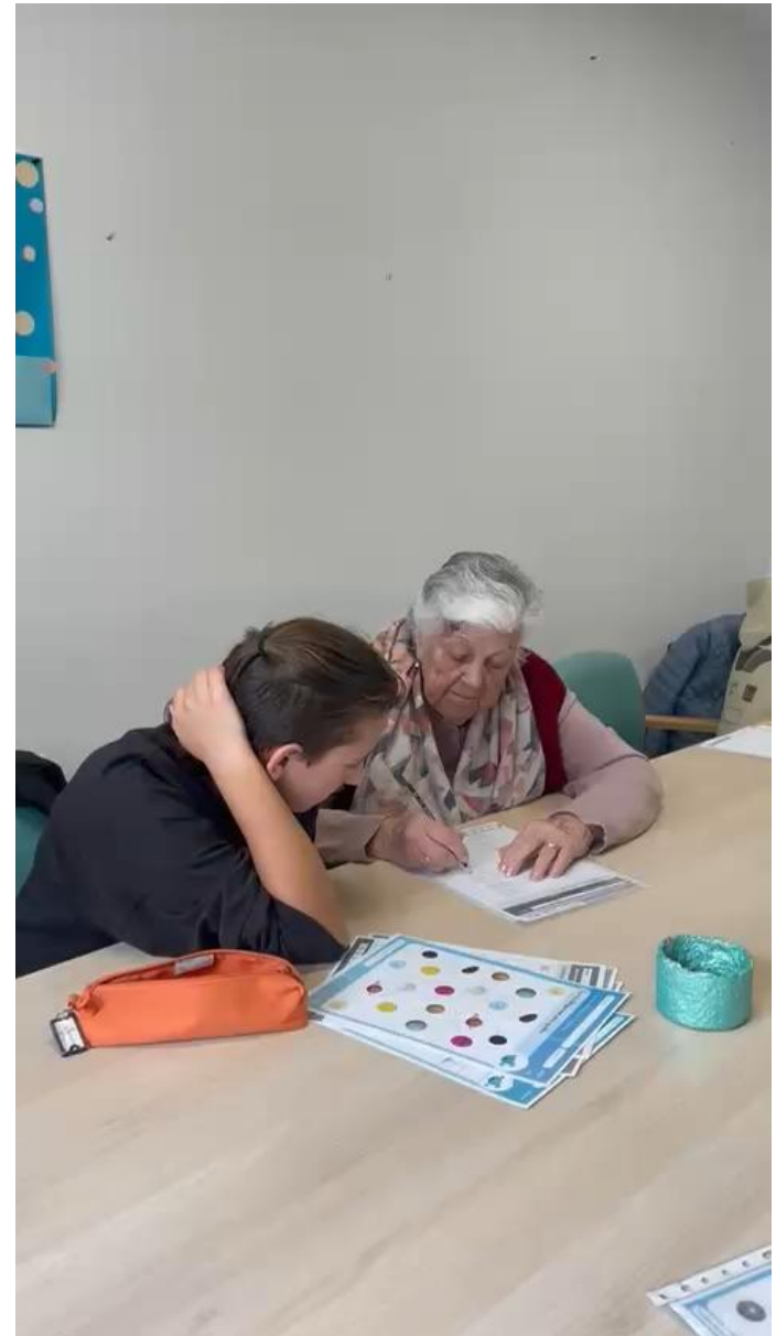
1) Talleres de estimulación cognitiva (6º de Primaria de CEIP Tresorer Cladera)