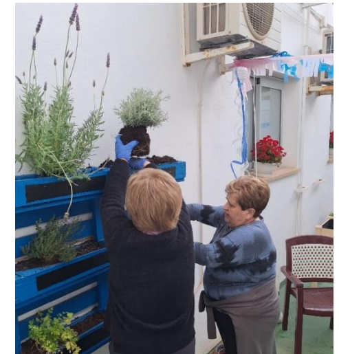
3) Talleres ocupacionales de jardinería (FP Jardinería y Floristería de CIFP Joan Taix)