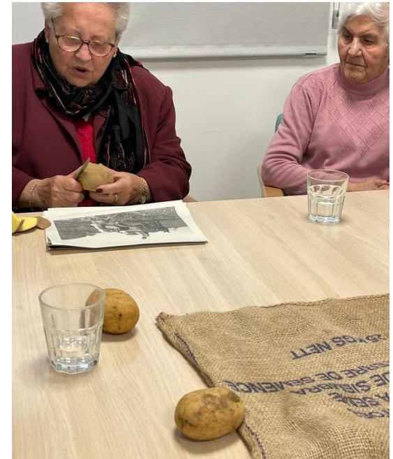
4) Proyecto etnográfico: testimonios y memoria colectiva del trabajo de campo.