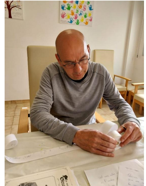
1) Albopàs Fest (Festival de teatro)