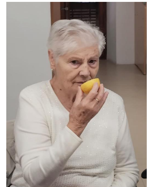
Taller "Cosmètica natural"