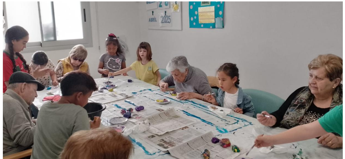
2) Talleres de manualidades (Infantil, 1º, 2º y 3º de Primaria de CEIP Nou)