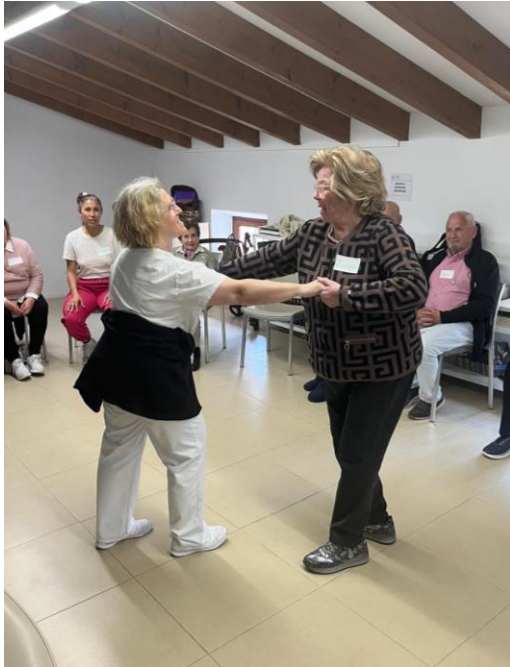
Taller "Cos, paraules"