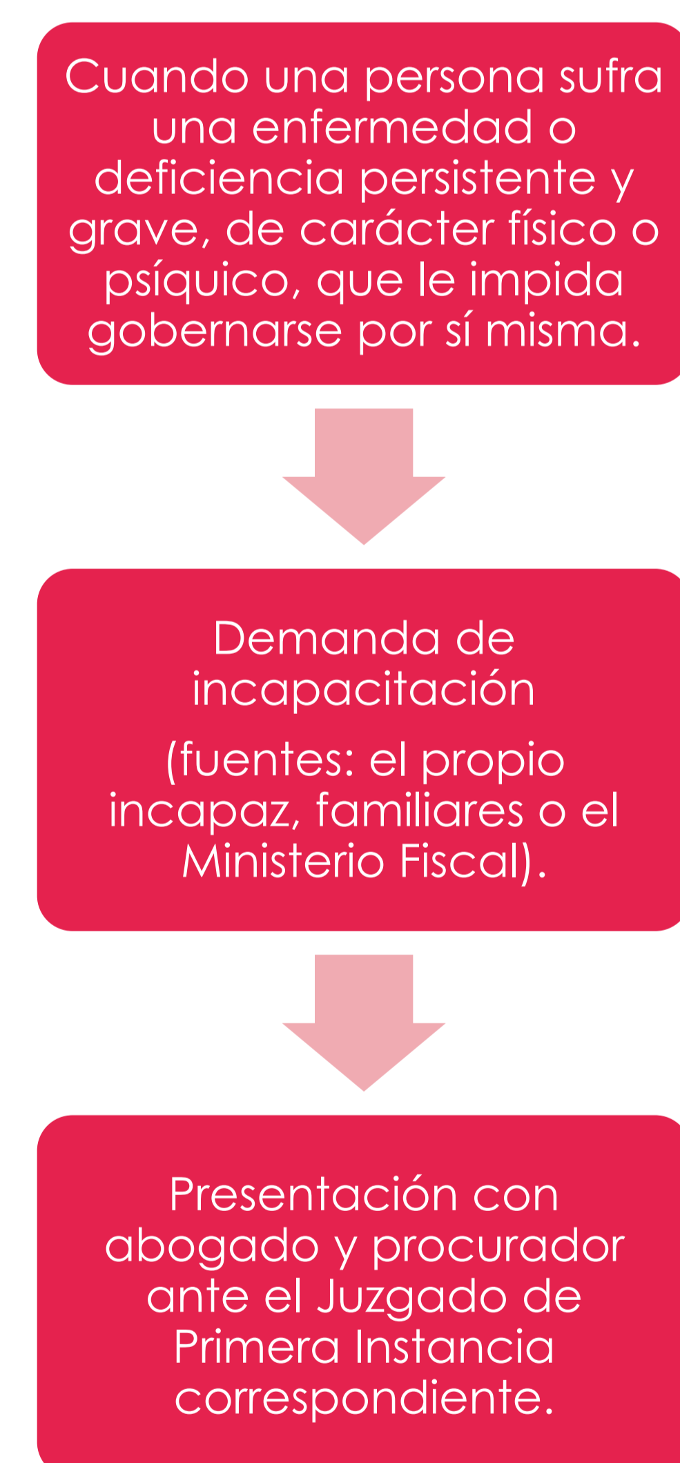
Figura 2. Proceso de incapacitación jurídica.